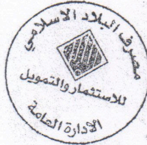
بسمة حامد محسن مديرة قسم الإستثمار